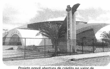
Projeto prevê abertura de crédito no valor de R$ 631,7 mil destinados para ações na difusão de atividades culturais no âmbito do município

a verba para auxiliar artistas culturais que atravessam dificuldades financeiras por causa da pandemia do covid-19, por intermédio da Lei Aldir Blanc (Lei Federal 14.017/2020). Lei essa que foi aprovada em junho deste ano pelo Congresso Nacional, com intuito de promover ações para garantir uma renda emergencial para trabalhadores da Cultura e manutenção dos espaços culturais brasileiros durante o período de pandemia.